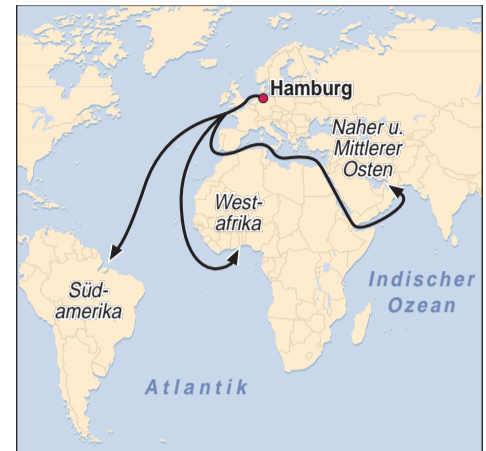
Vom Unikai-Terminal (l.) per Schiff in die Welt.